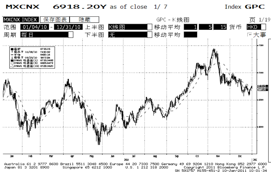
摩根士丹利 中国指数走势图 (2010.1.4-2010.12.31)